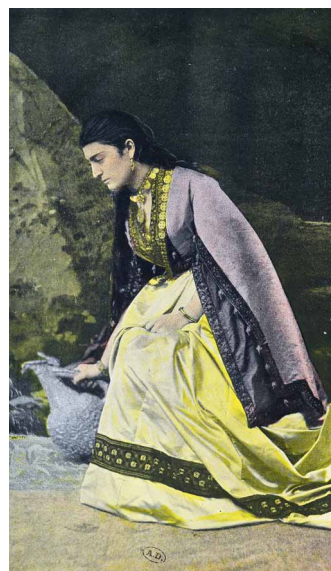
Mingrélienne à la fontaine, gravure en photochromie par Gillot, 1890

Terre mythique, le Caucase fascine tous ceux qui l'ont parcouru du fait de son exceptionnelle diversité culturelle et linguistique. Située entre la mer Noire et la mer Caspienne, cette contrée montagneuse présente un relief très compartimenté où de hautes montagnes succèdent à des vallées profondes, favorisant les particularismes locaux et les diversités humaines.