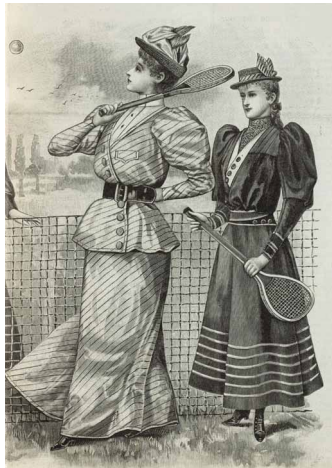
La Mode illustrée, n°21, 21 mai 1893