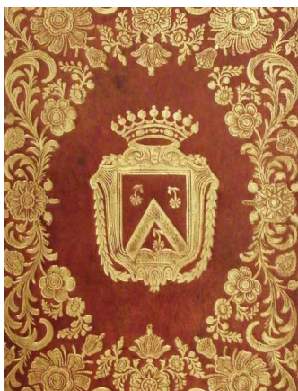
Almanach royal, 1790. Reliure armoriée en maroquin rouge plats décorés à la plaque