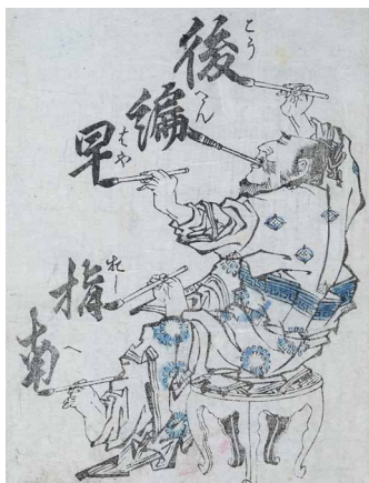
Méthode rapide pour apprendre à dessiner sans maître, Edo, 1850

Initialement fait pour être vu, montré et affirmer son appartenance à une certaine classe, le vêtement de sport au féminin a cependant participé, au fil des ans, au rejet du corset, à la libération de la silhouette et à l'émancipation de la femme.