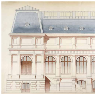
Projet d'installation au Quai d'Orsay, 1887

L'Union Centrale des Arts Décoratifs (UCAD) s'engage dans la recherche d'un emplacement adapté à la présentation de ses collections dès sa constitution en 1882. De nombreux projets sont étudiés, dont le plus crédible est celui du Palais du Quai d'Orsay, finalement rejeté par le Sénat en 1894. Deux ans plus tard, la démolition du Palais de l'industrie, qui